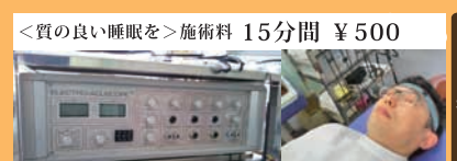
「質の良い睡眠を」施術料 15分間 ¥500

営業時間 12:00～18:00 定休日:月曜日(他イベント出店などでお休みあり) 茅ヶ崎市矢畑260-1 2F 電話 0467-40-4067