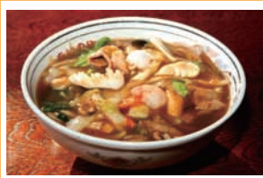
「たけのや」の逸品 広東メン 850円(税込)

個店の店主らが、自分たちで発掘・開発した店一番の「おすすめ商品」を積極的にお客様にアピールすることで、お店のイメージアップを図り、店のファンを増やそうという取り組みが「一店逸品運動」です。