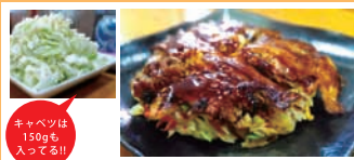
「関西風お好み焼き・焼きそば」を「たけのや」で焼き、茅ヶ崎で「てびん」 豚玉 500円(税込)

営業時間 11:00～20:00 水曜定休日 茅ヶ崎市矢畑728(矢畑ローソン前) 電話 0467-82-0014 http://takenoya.shonan-1.com「検索:たけのや 茅ヶ崎」