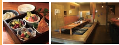
純手打ちうどん・旬菜さぬきや《特選御膳》11000円税別

営業時間: 8:30～17:30 定休日: 毎週水曜日/第1・3日曜日 茅ヶ崎市矢畑212-5 電話: 0467-55-9991 URL: http://www.ties-estate.co.jp/