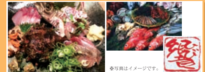
ひびき「おまかせ刺盛2人前位の量」16800円

営業時間: 昼: 11時～3時 夕: 18時～21時 定休日: 月曜日 ※日曜日は夕の部は営業しません。 電話: 0467-85-1771 住所: 矢畑699-4