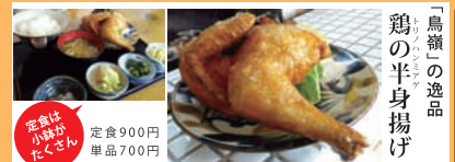
「鳥嶺」の逸品 鶏の半身揚げ

営業時間 11:30～14:30 17:30～21:00 月曜定休日 茅ヶ崎市矢畑699-12 電話 0467-84-8160 http://tecopin.shonan-1.com「検索:てびん」