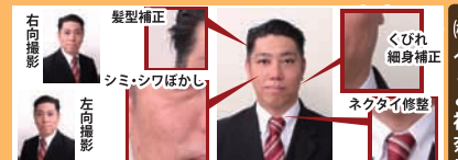
Kei's Pan 《フォカッチャ》 右側撮影 髪型矯正 左側撮影 シミ・シワほかし くびれ細身矯正 ネクタイ修整

営業時間: 10:00～17:00 営業日: 月曜日～水曜日 茅ヶ崎市矢畑3-8 サザンコート1階 電話:0467-87-3120